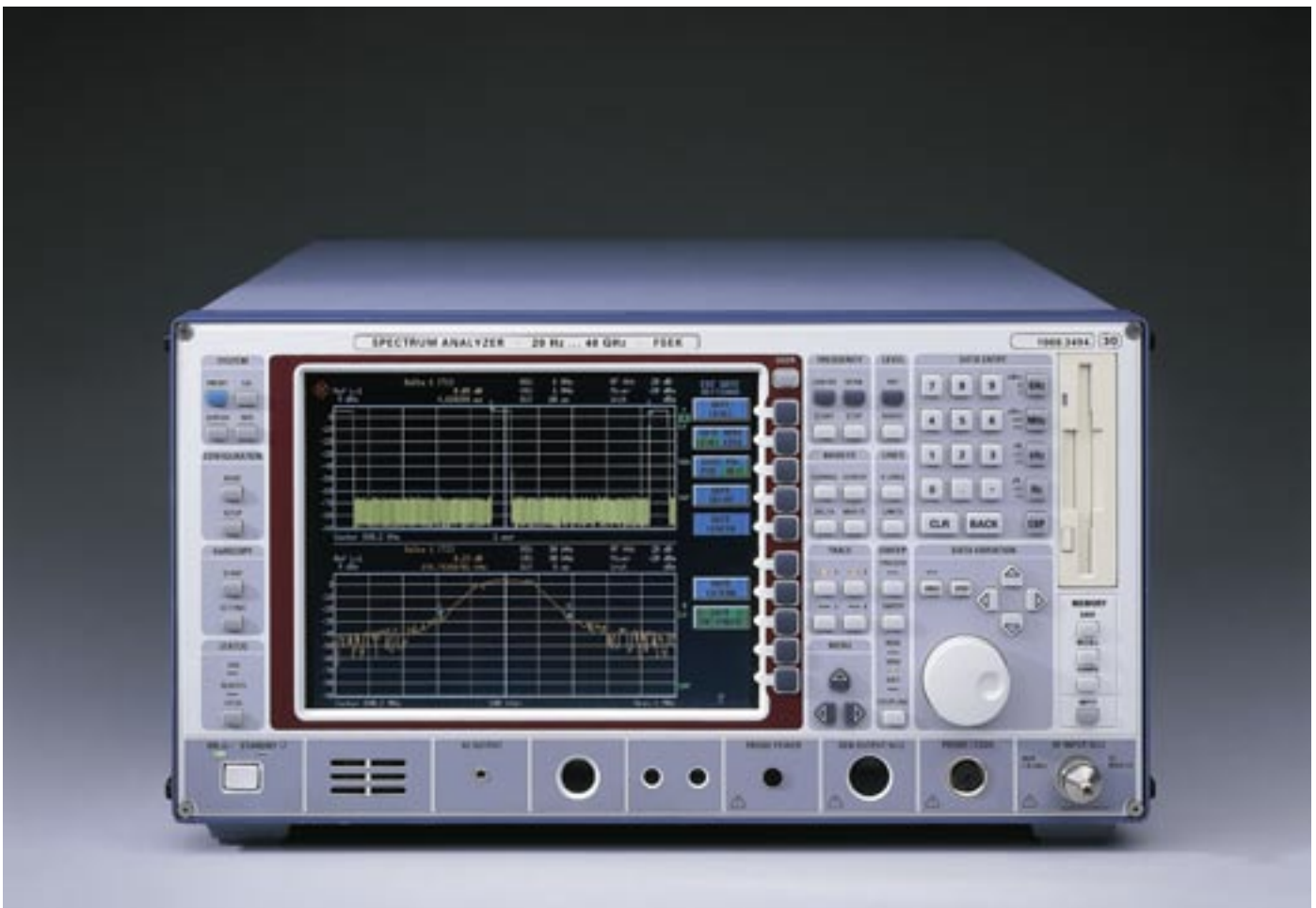
Dual use-Gut: Spektrum-Analysator

Wichtige Gesetzestexte und aktuelle Bekanntmachungen und Informationen stehen unter http://www.ausfuhrkontrolle.info bereit.