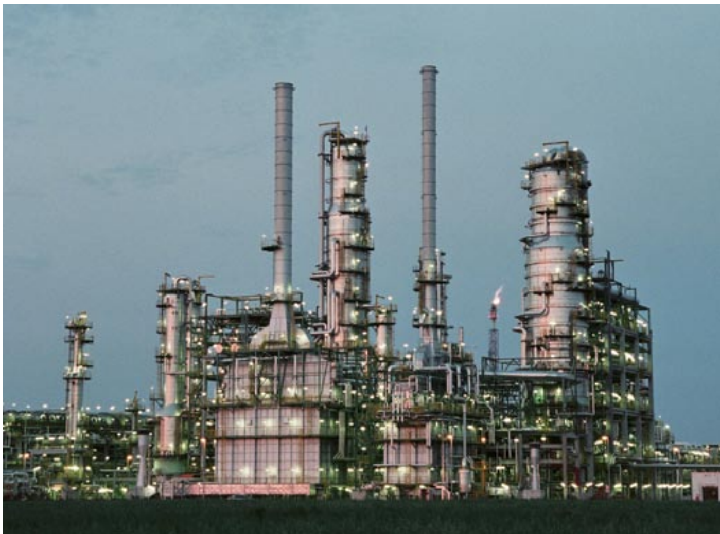
Anlage zur Herstellung von Chemikalien

In einer Reihe von Fällen trifft das BAFA die Entscheidung erst nach politischer Abwägung durch das Bundesministerium für Wirtschaft und Technologie und das Auswärtige Amt. Die Erteilung einer Genehmigung hängt auch von der Zuverlässigkeit des Ausführers ab. Hierzu kann das BAFA verlangen, dass der Antragsteller einen Ausfuhrverantwortlichen auf Vorstands- bzw. Geschäftsführerebene benennt.