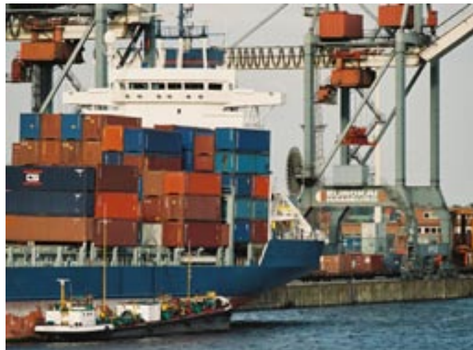
Containerschiff im Hamburger Hafen

Das BAFA veröffentlicht die Bedingungen, unter denen die Einfuhrgenehmigungen erteilt und die Überwachungsdokumente ausgestellt werden, als Ausschreibungen und Mitteilungen im Bundesanzeiger. Die amtlichen Veröffentlichungen sind im Internet unter: http://www.bafa.de abrufbar.